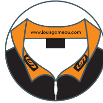
INTERIOR COLLAR / INTÉRIEUR DU COL