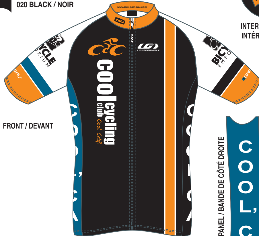
FRONT / DEVANT