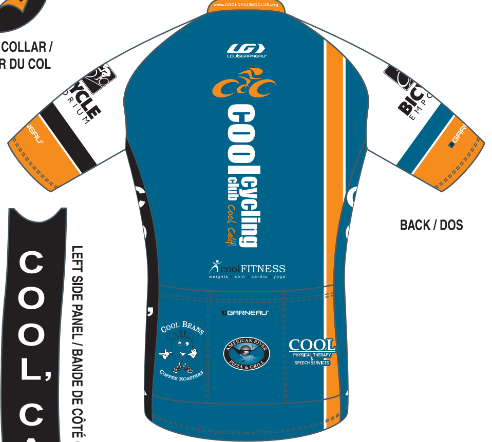
BACK / DOS