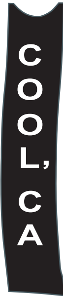
LEFT SIDE PANEL / BANDE DE CÔTÉ GAUCHE