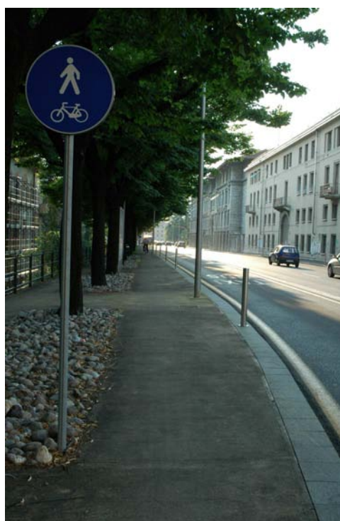
Corsia ciclabile su marciapiede in via Trento Percorso ciclopedonale in via Leonardo da Vinci

L'indagine condotta in settembre e che verrà riproposta anche il prossimo autunno, apre quindi interessanti prospettive riguardo l'efficacia delle politiche a favore della mobilità ciclabile: raccogliere informazioni utili a migliorare la sicurezza di tutti gli utenti della strada (in particolare di pedoni e ciclisti classificati come utenti deboli) risulta infatti fondamentale per definire e indirizzare i progetti futuri.