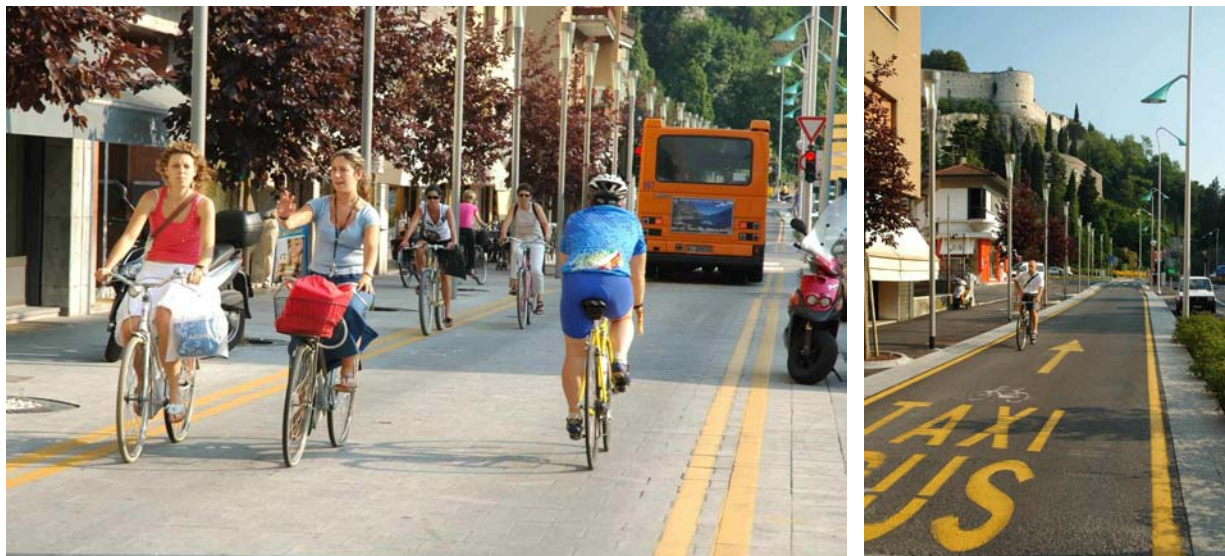
Corsia mista bici/LAM in via Crocifissa di Rosa

Un'altra importante novità potrebbe essere l' autorizzazione dei ciclisti a percorrere la corsia riservata bus/taxi e la corsia LAM, anche nel senso opposto a quello del bus.