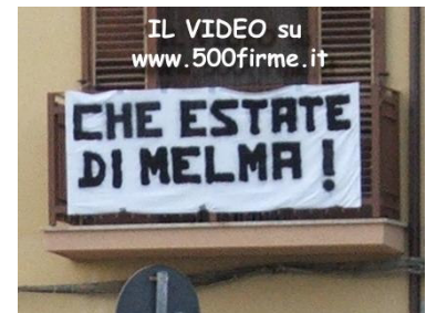
Selinunte, lavori di pulizia del porto fino a fine luglio!

Un semplice gesto per dire il proprio No alla mafia.