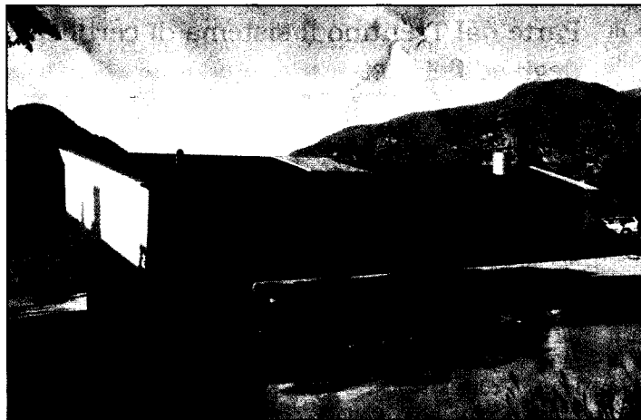
La scuola elementare Laion Ried a Laion, in provincia di Bolzano, premio CasaClima 2007 categoria energia (architetto Johann Vonmetz)

La metodologia LCA, riconosciuta e normata a livello internazionale (UNI EN ISO 14040, «Environmental Management - Life Cycle Assessment - Principles