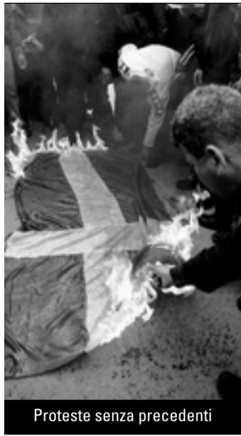
Proteste senza precedenti